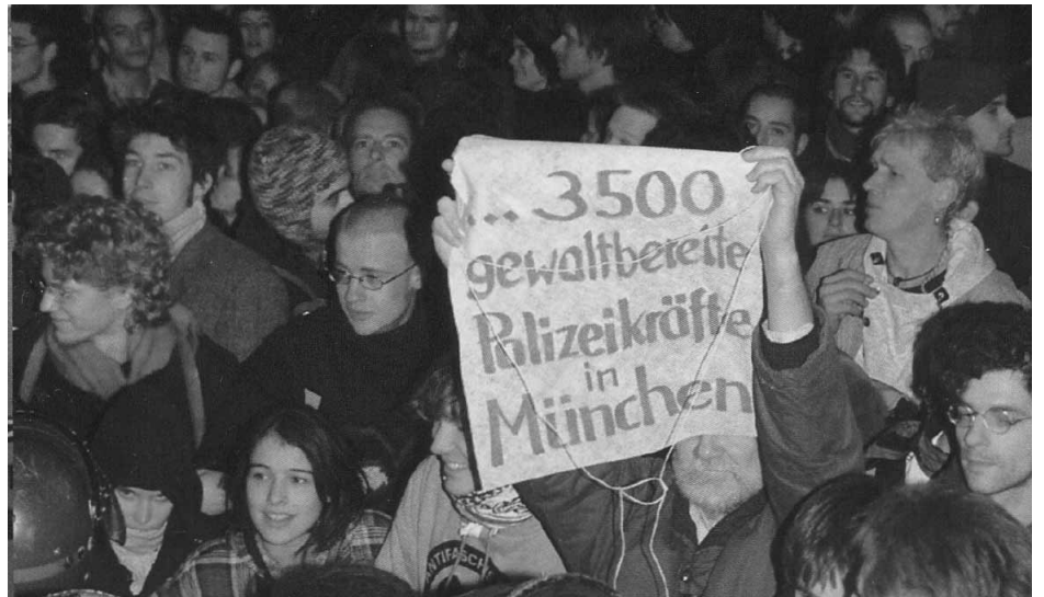
Manif contre le sommet de l'OTAN (2002) "... 3500 forces de police prêtes à la violence à Munich"

Davos devrait être complétée par des sponsors et de généreux donateurs. Le WEF comme à son habitude lorsqu'il s'agit de mettre la main au porte-monnaie est aux abonnés absents. Malgré le nom de la fondation, ses responsables expliquent que le WEF n'est pas comme par le passé au centre de leur préoccupation et que